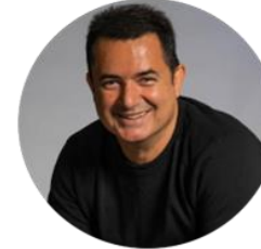
ACUN İLICALI ACUN MEDYA YK BAŞKANI