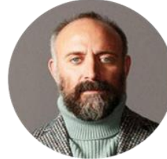
HALİT ERGENÇ AKTÖR