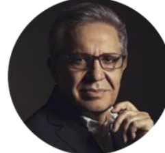
ZÜLFÜ LİVANELİ SANATÇI