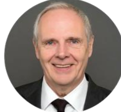
UNDO HANSEN DGQ YK BAŞKANI