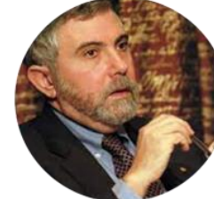
PAUL KRUGMAN NOBEL ÖDÜLLÜ EKONOMİST