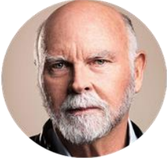
DIR. J. CRAIG VENTER CELERA GENOMICS KURUCUSU