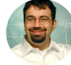
DARON ACEMOĞLU MIT EKONOMİ PROFESÖRÜ