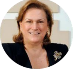
GÜLER SABANCI SABANCI HOLDİNG YK BAŞKANI