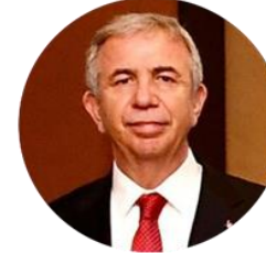
MANSUR YAVAŞ ANKARA BÜYÜKŞEHİR BELEDİYE BAŞKANI