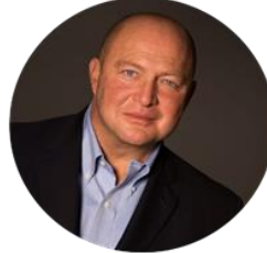
MUSTAFA V. KOÇ KOÇ HOLDİNG YK BAŞKANI