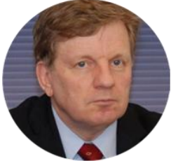
ESKO TAPANI AHO FİNLANDIYA ESKİ BAŞKANI