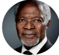
KOFI ANNAN BİRLEŞMİŞ MİLLETLER ESKİ GENEL SEKRETERİ