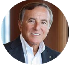
BÜLENT ECZACIBAŞI ECZACIBAŞI HOLDİNG YK BAŞKANI